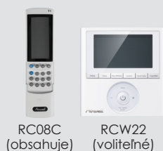
RC08C (obsahuje) RCW22 (voliteľné)