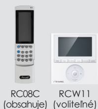
RC08C (obsahuje) RCW11 (voliteľné)